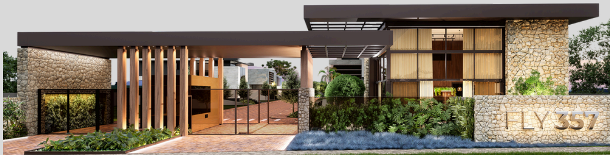
Condomínio Fly 357 Monreal Construtora Áreas comuns e diversas residências internas

Residencial Treviso 9 residências internas Áreas comuns Mais de 1.200m 2 de área construída